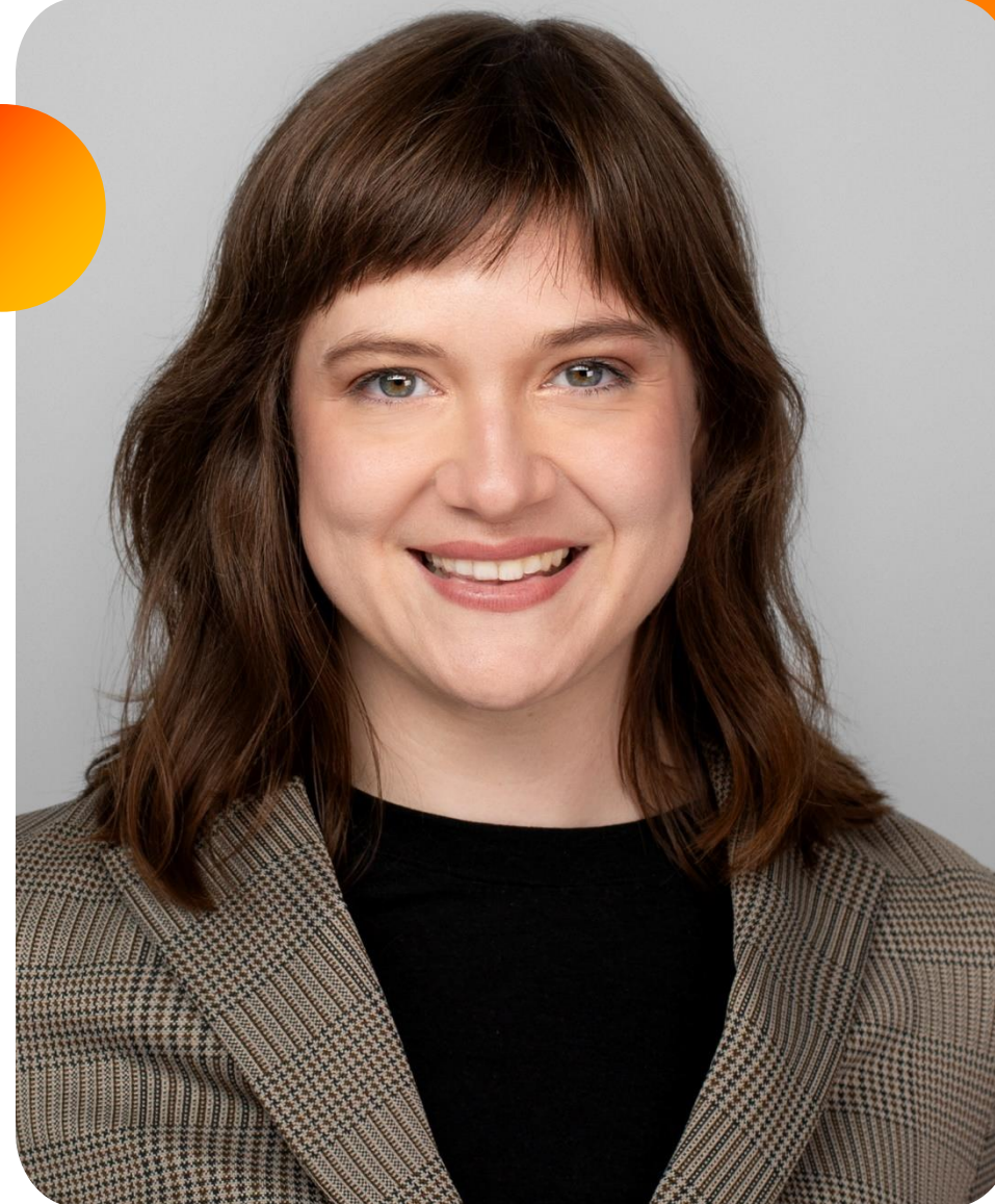
Anna Maria Ortese